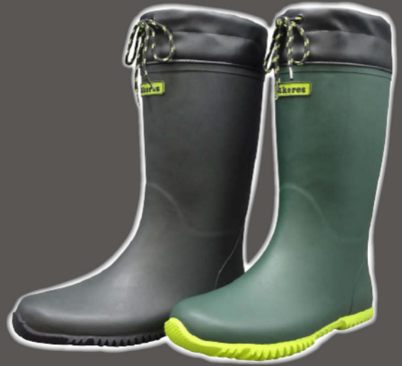
Col. ダークグレー Col. ダークグリーン